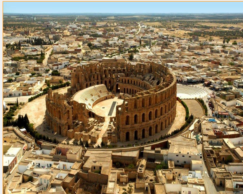
Amfiteatrul roman din El Jem