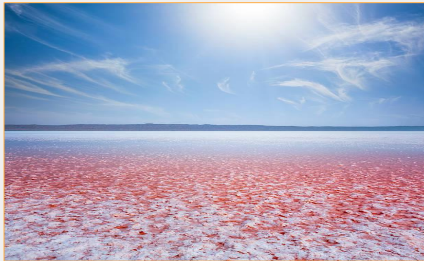
Lacul sărat Chott El Jerid