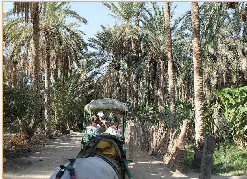
Centru vechi Tozeur