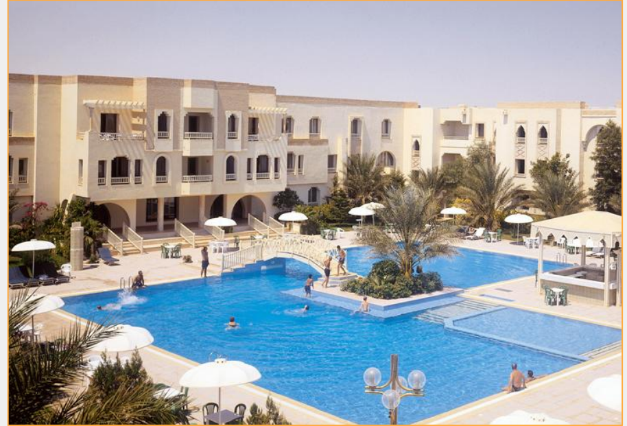
Hotel EM Douz