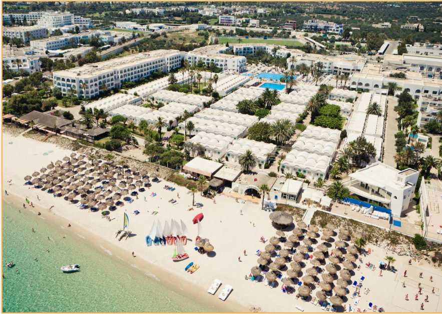
Hotel EM Club Kantaoui